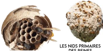
LES NIDS PRIMAIRES DES REINES FONDATRICES

Au printemps, la reine fondatrice crée son premier nid. L'objectif de la municipalité est de l'empêcher de s'installer, et de détruire les nids existants avant l'éclosion des œufs.